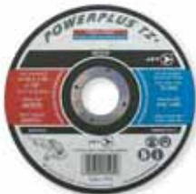
TYPE 1 - THIN / MINCES

** purchase 100 get 10 FREE Achat de 100 obtenez 10 GRATUIT