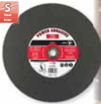
TYPE 1 - THIN / MINCES