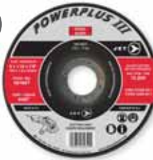
TYPE 1 - THIN / MINCES